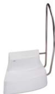
schůdek dvoustupňový laminátový s nerez zábradlím