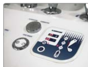
LED displej u elektronického ovládání