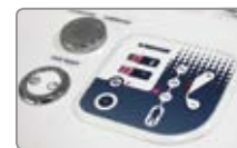
LED displej u elektronického ovládání