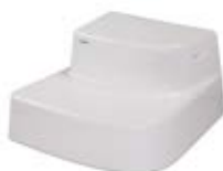
schůdek dvoustupňový laminátový