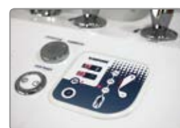
LED displej u elektronického ovládání