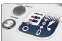
LED displej u elektronického ovládání